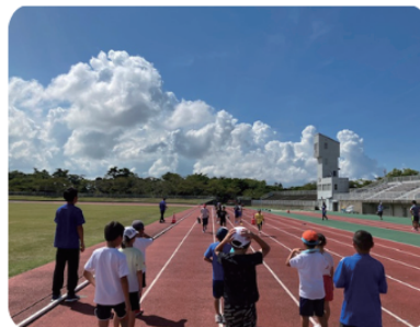
スポーツIN陸上競技場