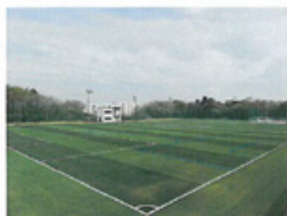
三国運動公園人工芝グラウンド